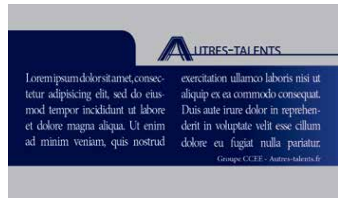
Le document coupé qui vous sera livré.