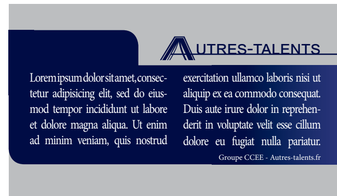
Le document coupé qui vous sera livré.