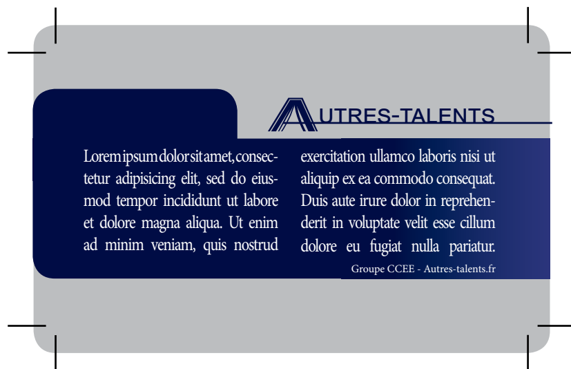
Exemple de document que vous devez fournir