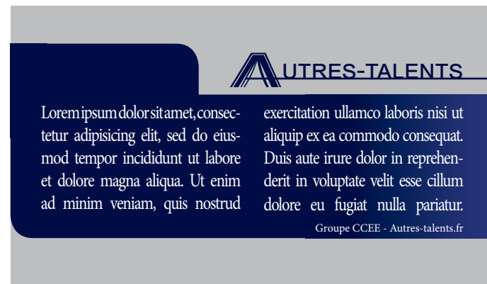
Le document coupé qui vous sera livré.