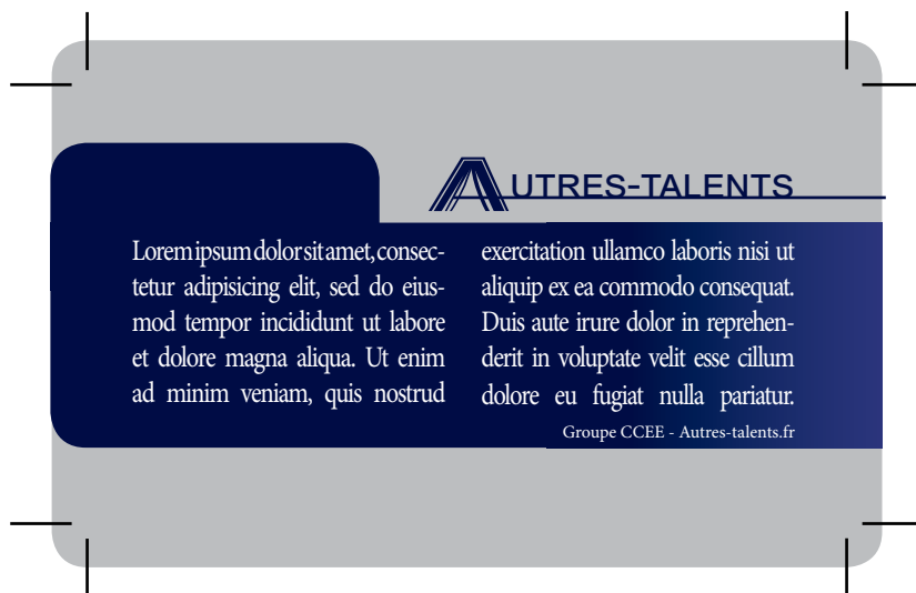
Exemple de document que vous devez fournir