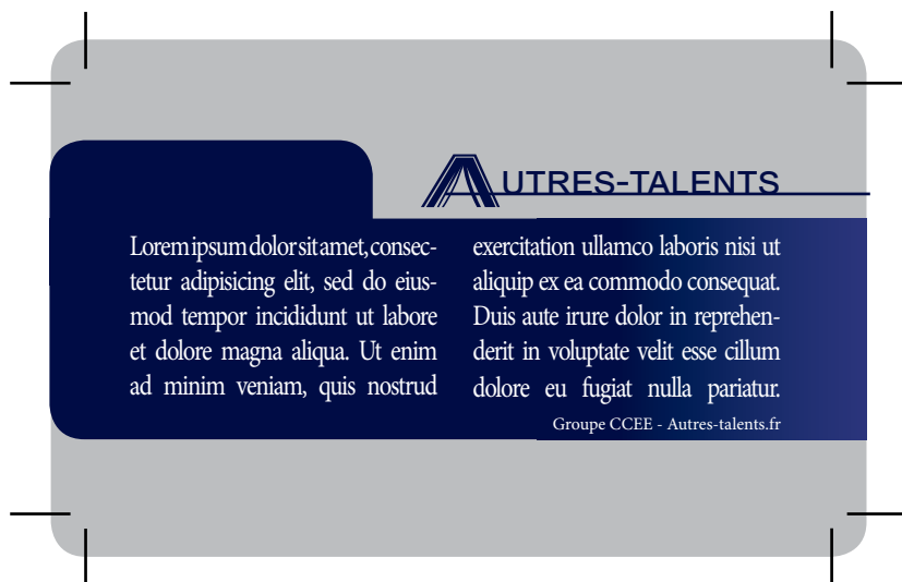
Exemple de document que vous devez fournir