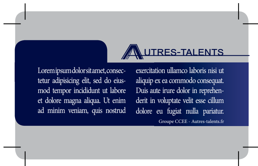
Exemple de document que vous devez fournir