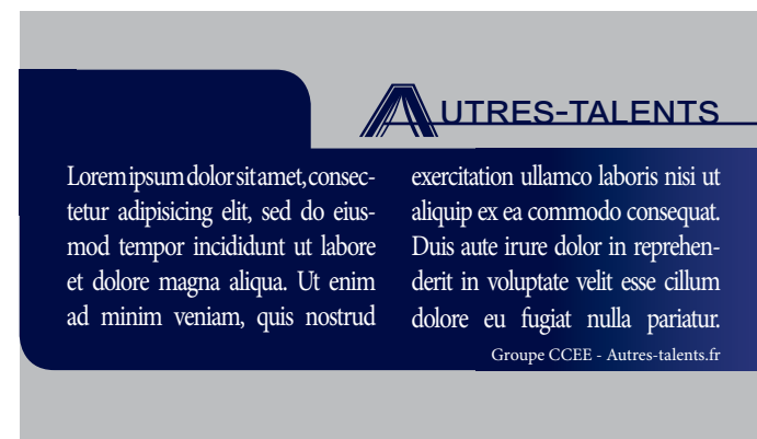
Le document coupé qui vous sera livré.