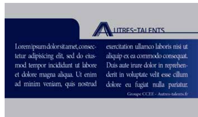
Le document coupé qui vous sera livré.