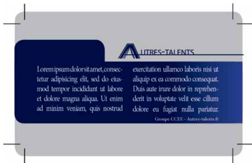
Exemple de document que vous devez fournir