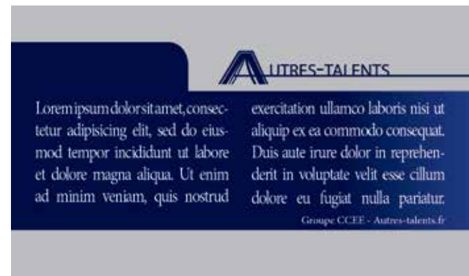
Le document coupé qui vous sera livré.